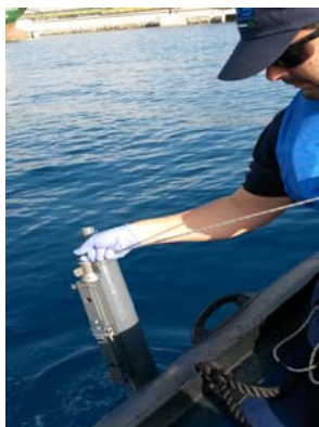
Toma de muestras con botella oceanográfica (muestras integradas)