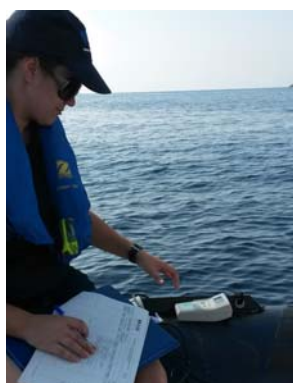
Toma de datos in situ