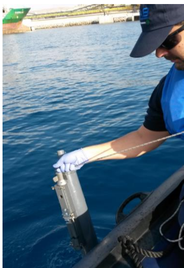
Toma de muestras de agua con botella oceanográfica (muestras integradas)

A continuación se muestran algunas fotografías tomadas durante la toma de muestras y medidas in situ .