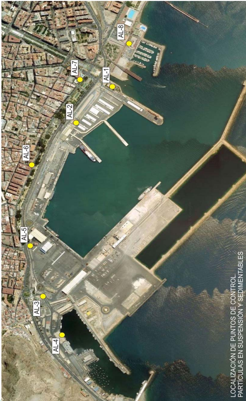
LOCALIZACIÓN DE PUNTOS DE CONTROL. PARTÍCULAS EN SUSPENSIÓN Y SEDIMENTABLES