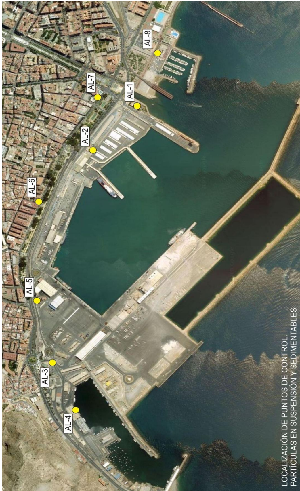
LOCALIZACIÓN DE PUNTOS DE CONTROL. PARTÍCULAS EN SUSPENSIÓN Y SEDIMENTABLES

Entidad colaboradora en materia de CALIDAD AMBIENTAL REC-0054